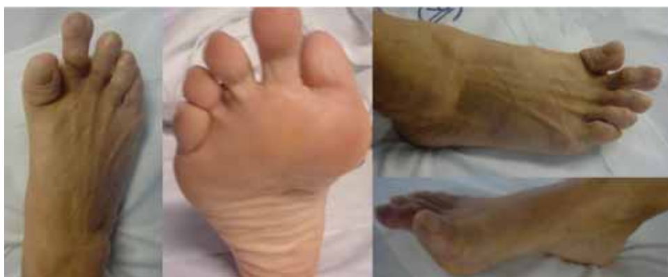
Figura 1. Secuelas estéticas y biomecánicas de la articulación metatarsofalángica secundarias a técnica quirúrgica de Keller-Brandes.

En un tercer tiempo, aprovechando la incisión bajo previa limpieza del espacio metatarsofalángico, se retira tejido