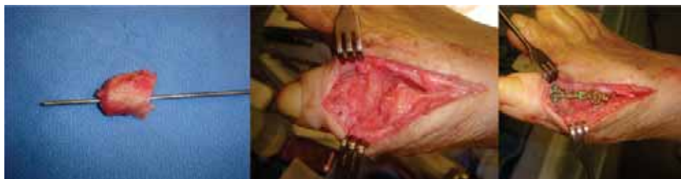
Figura 7. Injerto autólogo corticoesponjoso tallado, procedente de cresta ilíaca, el cual fue fijado con placa de bajo perfil.