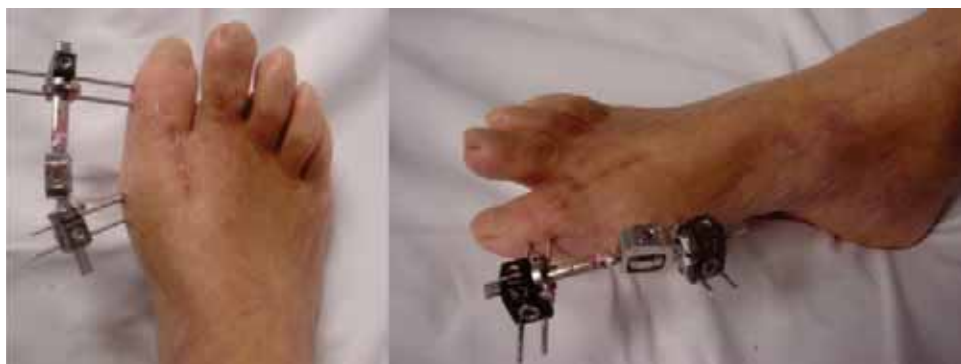
Figura 5. Aspecto clínico tras elongación progresiva del primer dedo del pie.