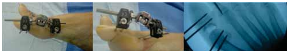
Figura 3. Colocación del minifijador externo en el fragmento de falange proximal y en el primer metatarsiano.