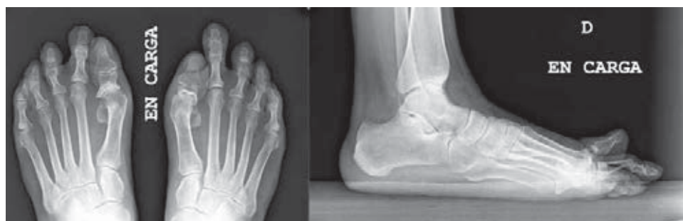
Figura 2. Imagen radiológica anteroposterior y lateral en carga, previa a intervención quirúrgica.