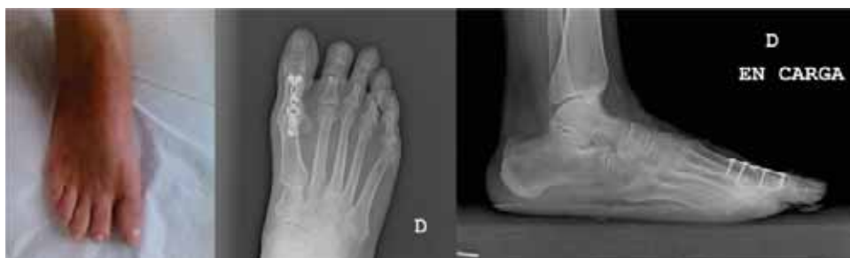
Figura 8. Resultado final clínico y radiológico de la paciente.

3. Resultado malo: Fracaso de la artrodesis. Dolor constante, dificultad para poner calzado. Complicaciones. Seudoartrosis. Paciente descontento.