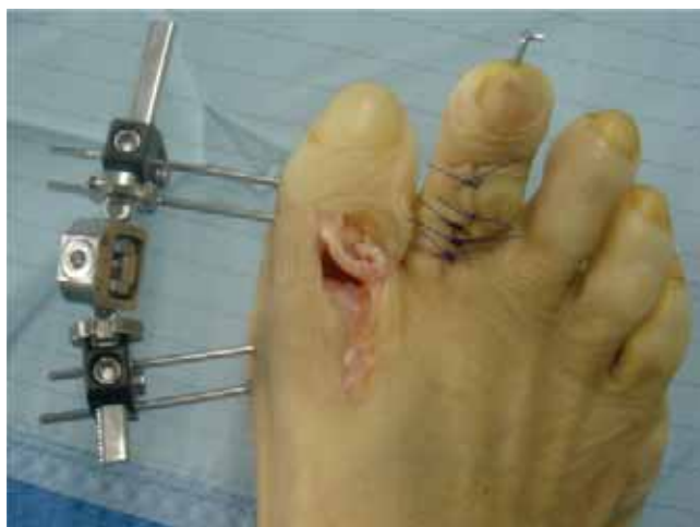
Figura 4. Artroplastia de la articulación metatarsofalángica y alargamiento del extensor largo del primer dedo.

fibrótico, y se liberan partes blandas y restos de cartílago. Se intercala el injerto autólogo corticoesponjoso procedente de cresta ilíaca, previamente tallado, de unos 2.0-2.2 cm, fijado con placa de bajo perfil, con efecto de compresión para